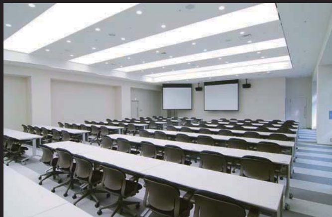
あらゆるレイアウトに対応可能な研修室。シンプルゆえの使い勝手の良さがある。(幕張)