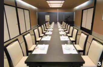
1 まるでリゾートホテルの様な府中のアトリウム、非日常空間での研修に心が躍る。(府中) 2 広々とした宿泊室は、一日の疲れを取るのに十分なスペック。デスクワークにも対応の広めの机を設置。(梅田) 3 完全個室の宴会場もご用意、四季折々の料理を囲み交流が深まっていく。(船橋) 4 「クロス・ウェーブ梅田」総支配人の上野敦子さん(写真右)と「クロス・ウェーブ幕張」カンファレンスコーディネーターの鳥佳奈子さん(写真左)。