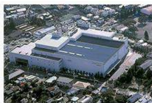
東京技術センター

レンタル終了後はお電話1本のご連絡だけで引き取り手続きを行います。オリックス・レンテックは国際規格に適合した品質マネジメントシステムISO9001の認証を取得しており、レンタル機器は厳重かつ確実な検査を実施して品質を保持しています。