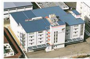
神戸技術センター