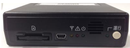
デジタルタコグラフ認証 (国土交通省型式指定番号: (自) TDII-51)